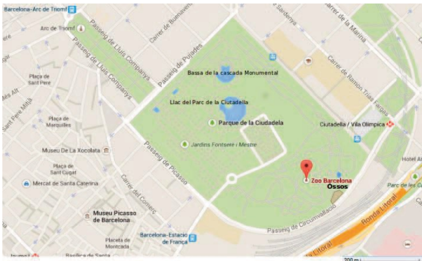
Comparativa: superfície instal·lació dels óssos en relació a la resta del Parc de la Ciutadella

Els plans del Zoo de Barcelona és mantenir els óssos en el segon nivell de programa de cria per a espècies en perill. Malgrat això, no es troben inclosos en cap programa de reintroducció.